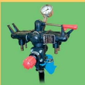
CD4 - 4 sorties avec obturateur général et régulateur de pression