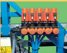
Vannes motorisées électriques à sphère inox