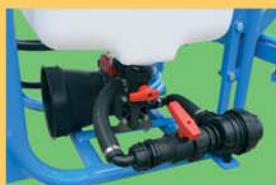
Puisard avec vanne de vidange, filtre d'aspiration extérieur à cartouche démontable avec vanne d'arrêt + protecteur cardan