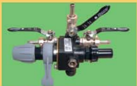
Distributeur avec régulateur de pression (3 ou 4 sorties en fonction des modèles)